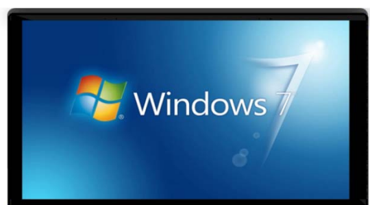
鋁拉絲外框,鋼化玻璃表面,冷軋板後蓋金屬噴漆.